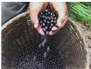
Figura 1 - Açaí

Martius ) ocorre desde a Bahia até o Rio Grande do Sul, no litoral, em locais úmidos e sombreados, com exceção do mangue, e com menor intensidade nas formações florestais interioranas. Recebe também os nomes de juçara, palmito-doce e içara. Eduilis significa comestível, e nesse caso, se refere ao palmito.