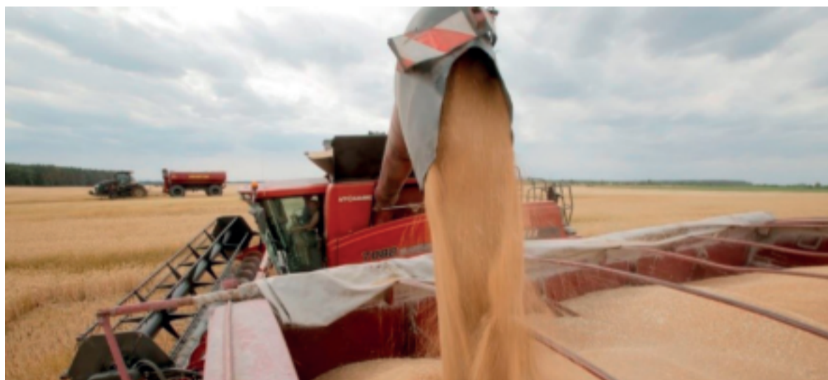
Foto: FAO/Anatolii Stepanov. Colheita de trigo perto da vila de Krasne, na Ucrânia.