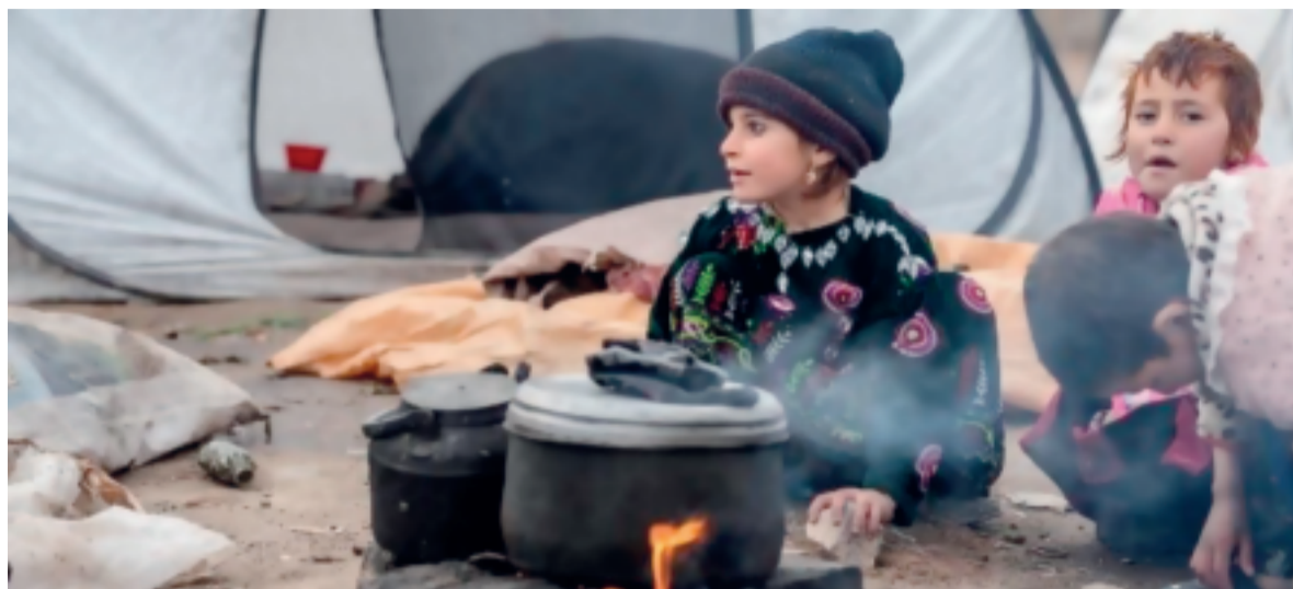
Impacto dos conflitos sobre pessoas mais vulneráveis.

A fome e a insegurança alimentar, antigos problemas da sociedade, são agravados em regiões com elevados índices de desigualdade social. Propor soluções para esse quadro requer uma abordagem multidimensional, que possibilite a interação entre as dimensões sociais, culturais, políticas, econômicas e ambientais envolvidas na produção e na distribuição de alimentos.