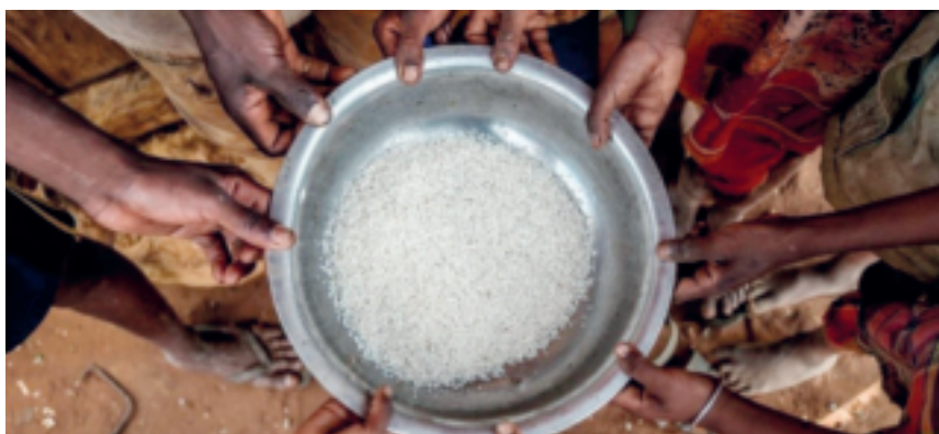
Foto: Unicef/Safidy Andriananten. Secas em Madagascar colocam o país africano entre aqueles onde há mais fome.

Disponível em: https://news.un.org/pt/story/2022/05/1788102 . Acesso em: 10 jun. 2023.