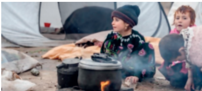
Impacto dos conflitos sobre pessoas mais vulneráveis.

A fome e a insegurança alimentar, antigos problemas da sociedade, são agravados em regiões com elevados índices de desigualdade social. Propor soluções para esse quadro requer uma abordagem multidimensional, que possibilite a interação entre as dimensões sociais, culturais, políticas, econômicas e ambientais envolvidas na produção e na distribuição de alimentos.