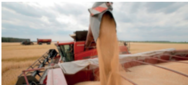
Colheita de trigo perto da vila de Krasne, na Ucrânia.