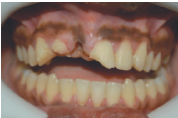
Figura 1: Condição clínica do paciente