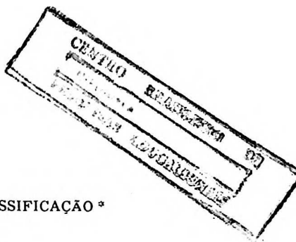
TABELA DE CLASSIFICAÇÃO *