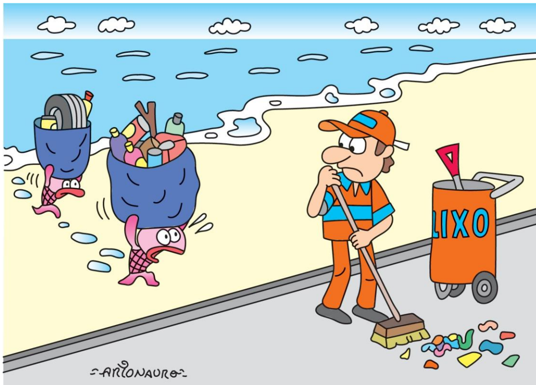
LAZOSKI, R. S. Material didático pedagógico: unidade temática “o gênero textual ‘charge’ em sala de aula: leitura, interação e criticidade”. Cadernos PDE . Secretaria de Estado do Paraná — SEE. Mallet — PR, 2014.

Em uma escola localizada em uma comunidade composta majoritariamente por famílias que vivem da pesca artesanal, a professora de uma turma do 3º ano do Ensino Fundamental planeja realizar uma atividade pedagógica que esteja alinhada à Base Nacional Comum Curricular (BNCC), valorize o cotidiano de seus alunos e promova o olhar crítico deles. A docente pretende desenvolver, nos estudantes, a habilidade de “inferir informações implícitas nos textos lidos”, tendo definido “leitura/escrita (compartilhada e autônoma)” como práticas de linguagem e “estratégia de leitura” como objeto de conhecimento. Para tanto, a docente utilizará a seguinte charge em sala de aula.